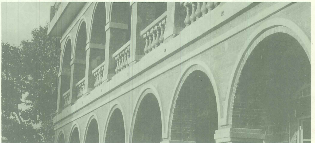
千禧年前夕紅樓的再利用，是她一百歲生日意義最深重的禮物