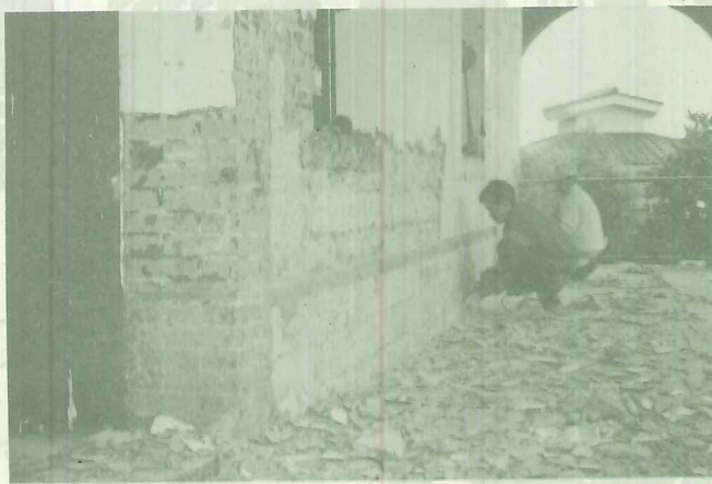
工人整修/工程最初僅以人力小心地將外層黃水泥牆一片一片敲下，進度緩慢費時許久