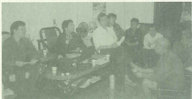
專家與居民們齊聚客廳，播放社區營造幻燈影片，引起熱烈討論

淡水捷運站後公園連接河岸一段的草厝尾社區管理委員會(公明街56巷)自今年11月起，每隔二週的星期三晚上與淡江大學建築系、淡水社區工作室、淡水文化基金會等，連續舉辦四場「造街與環境美化系列講座」，地點設於公明街56巷11號3樓居民家中的客廳，鄰居們就近關心、討論，對社區環境的美化充滿理想！11月10日首先邀請中原大學建築系講師陳宇進，講述「馬公中