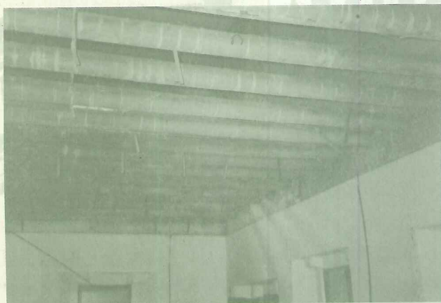
天花板的橫樑/紅樓屋內木製樓板經多年腐蝕不敷使用，此次修整加以鋼筋水泥補強結構之穩固

在回淡水的渡船上，「紅樓」仍舊挺立，他的身影是淡水山城豐富景觀的一部份; 仍舊樂觀，讓我們藉由此一起點，再去行動、去尋找、去修補、去經營那一幅幅孕育淡水文化經驗的城市景觀。